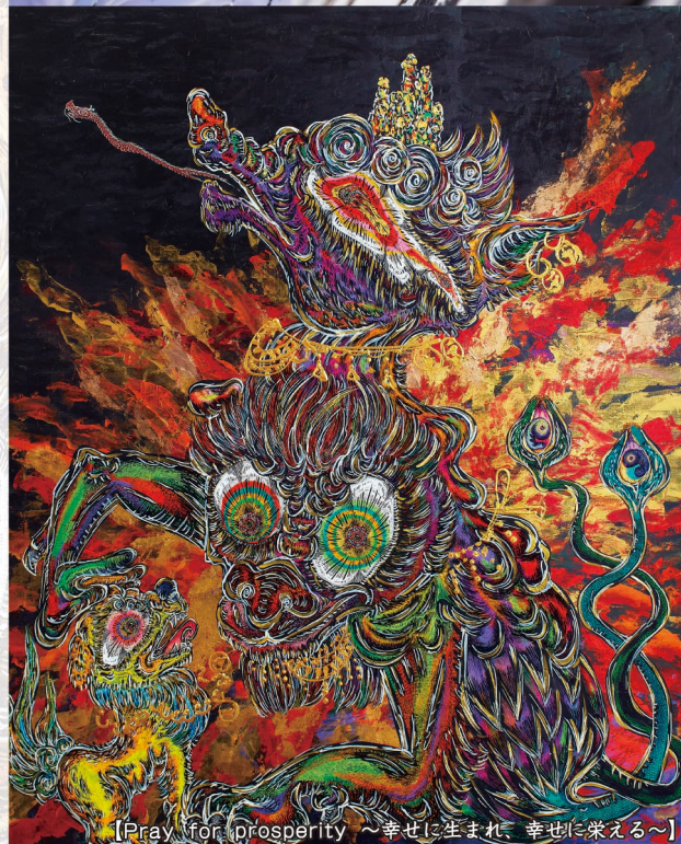
[Pray for prosperity ~幸せに生まれ、幸せに榮える~]