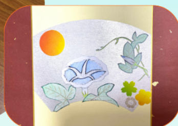
作品例(スタッフ作)